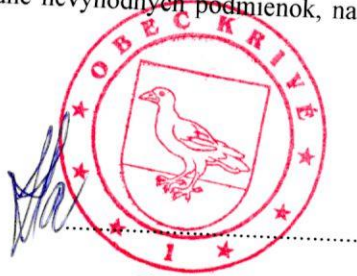
Obec Krivé Objednávateľ